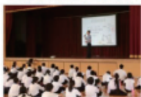
中学校出前授業（法教育）風景

小・中・高校や児童福祉施設などでの、非行防止教室にも力を入れています。 内容や人数、時間は御希望に応じます。